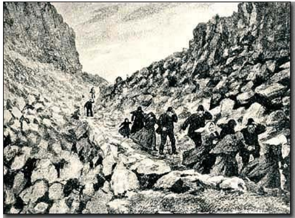
Theodor Kittilsen har laget mange tegninger etter sine besøk på Værøy og Lofoten.

I den gamle grenda, Måstad, livnærte man seg ikke bare på fisken i havet, men også på lundefuglen som lever i fuglefjellene i sørvest. Lundefuglen er i dag fredet, men preger kommunevåpenet vårt og har en sterk symbolverdi for kommunens innbyggere. Værøy kommune har mange kreative næringsaktører, og Lofotens eneste sjokoladefabrikk befinner seg på den nedlagte flyplassen på nordsiden av øya. Foruten et uovertruffent turterreng både til lands og til vanns, har Værøy en rekke vakre kulturminner å vise fram. Lofotens eldste kirke med sin staselige løkkuppel er et av dem.